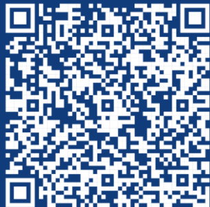
Kalss/Krönke/Völkel, Crypto-Assets (2024)